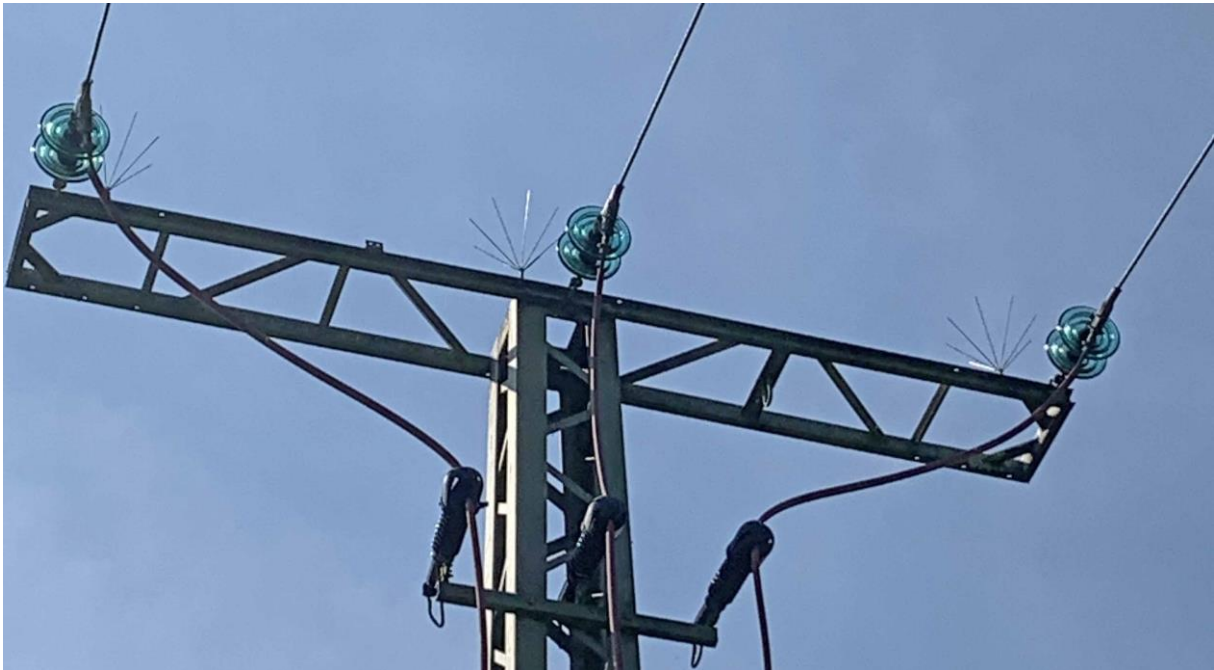
EAM Netz / Telefonat und E-Mail / Foto: EAM Netz