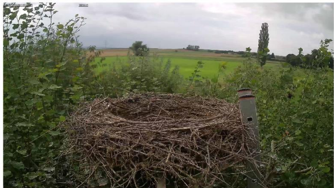
ohne Nestpolster (Biomüll)

Am Montag (6. September) habe ich noch einen Trupp von 20 erwachsenen Störchen am Rande der Radenhäuser Lache gesehen. Dienstag noch 12, Mittwoch noch 2 und heute saß nur 1 Jungstorch in einem der freistehenden Nester.