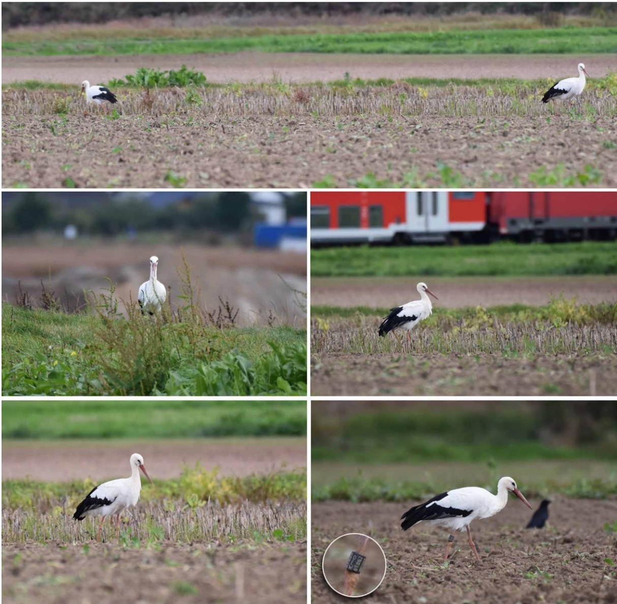
Claudia Born / E-Mail

„...ich habe es heute mal geschafft, die Niederweimarer Störche mit dem Tele einzufangen, fünf Bilder schicke ich Dir zur Info. Ein Storch ist beringt mit der Nr. 6T862 , der andere hat keinen Ring. Ich habe sie im September ziemlich oft gesehen, entweder auf dem Storchennest frühmorgens oder in der Nähe des Kreisels Niederweimar-Wenkbach , wie heute auch, wo die Fotos entstanden sind.