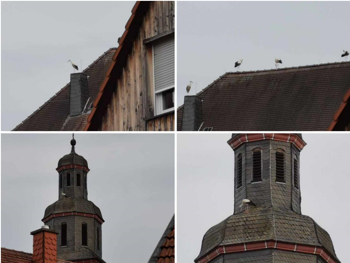
Martin Kraft / MRVW / WhatsApp