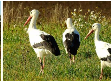
↑ DER AL063