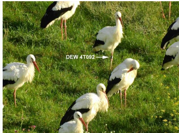
und von Amönau

Vom 15. November bis 15. Januar beobachtete Störche werden als Winterstörche eingestuft.