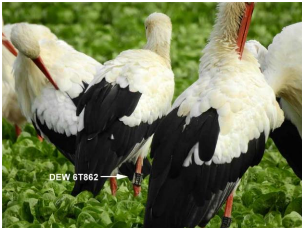
Storch von Niederweimar

„Hier die Mitteilung, dass auch die Störche DEW 6T862 (seit ca. 10.10.20) und DEW 4T092 (ca. seit 04.11.20) hier bei Büttelborn anwesend sind. ...“