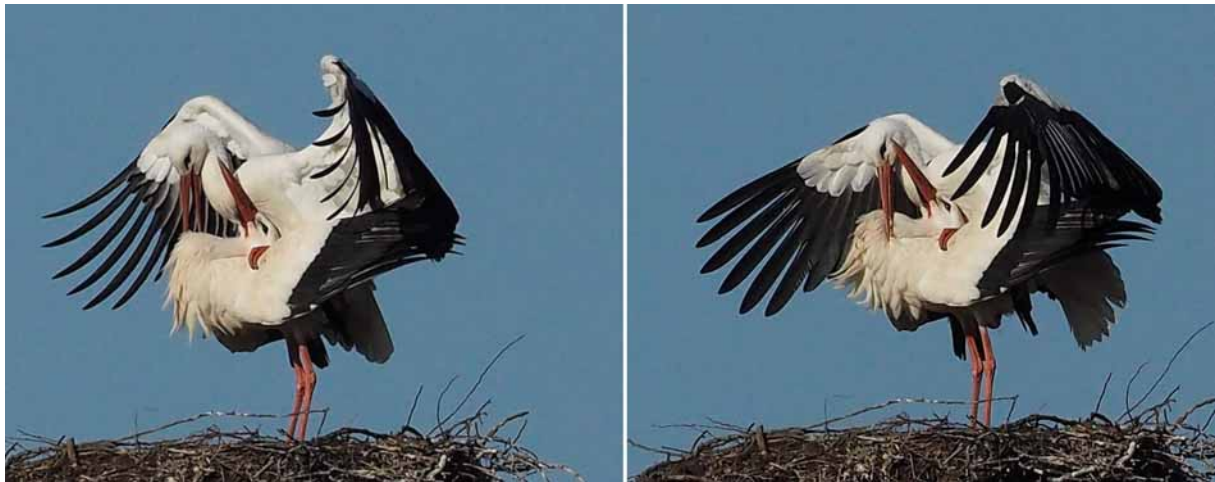
Michaela Weickelt / WhatsApp

Fotos von Mast 5 dieser Tage. Das Weibchen ist nicht beringt - demnach hat es einen Wechsel gegeben. Das Männchen hat die Ringnummer 8X624.