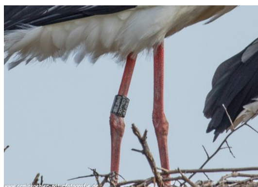
♂ DER AL063