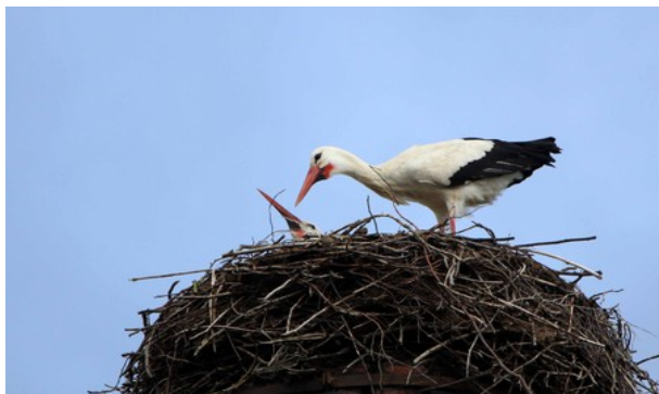
Störche in Rauischholzhausen