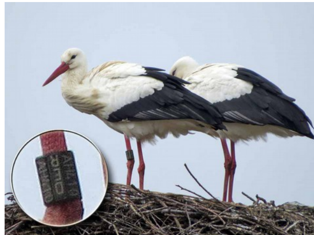
„Angela“ DER AH410 und „Coco“ auf Hachborner Storchhorst