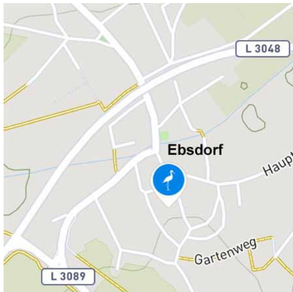
Senderdaten von "Libi"