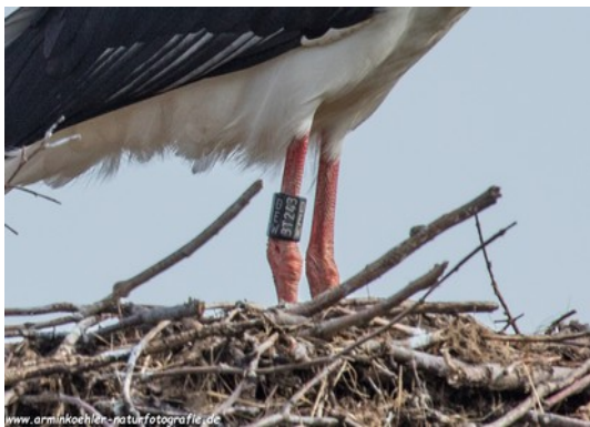
♀ DEW 3T243