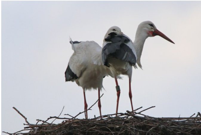
"Coco" (li) und "Angela" (re) auf dem Storchenhorst

Vorjahen hat inzwischen eine neue Partnerin – das Weibchen „Angela“ (Ring Nr. DER AH410 ). Diese Störchin kennt den Landkreis recht gut, hat sie doch in den Jahren 2013 bis 2015 bei Fronhausen und 2016 bis 2018 in Rauschholzhausen gebrütet.