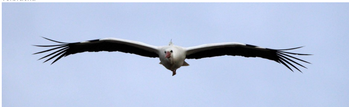
"Libi" mit Sender auf dem Rücken

Daten ihres Senders, auf einem Freileitungsmast in nur 250m Entfernung zu ihrem ehemaligen Horst verbracht.