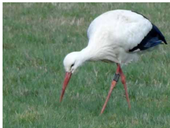
AH 410 bei der Nahrungssuche